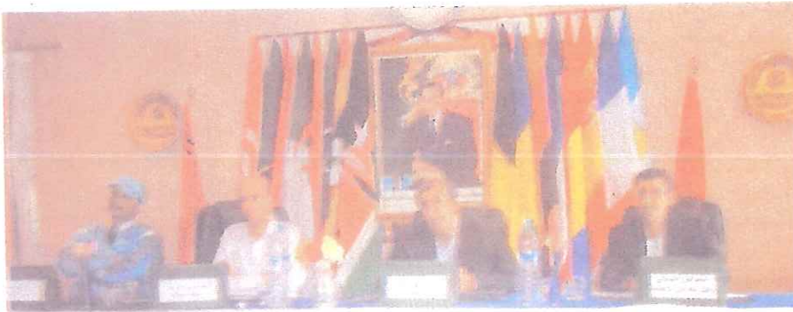
في إطار المهرجان الثقافي ورياضي الذي يفتتحه سوق السبت بالمدينة

40 مليون سنتيم مصاريف التظاهرة و15 ألف درهم للفائز